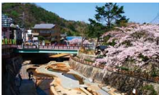
有馬温泉と有馬川、親水公園、太閤橋の桜

関西の奥座敷、1300年の歴史を持つ日本最古の名湯有馬に、月光園が根をおろして60有余年。伝統を受け継ぐ一方、変化する時代とお客様のニーズに呼応すべく、従来型の発想にとらわれない挑戦を果敢にしていまいりました。