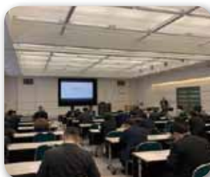
セミナー 受講風景