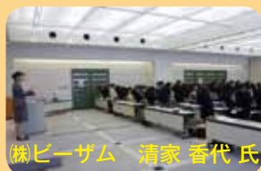
株ビーザム 清家 香代氏